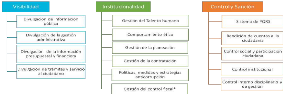
Gráfica de Factores e Indicadores

Riesgos de Corrupción entendidos como la posibilidad de que ocurra un hecho de corrupción y se centra en tres factores de análisis que contienen 15 indicadores.